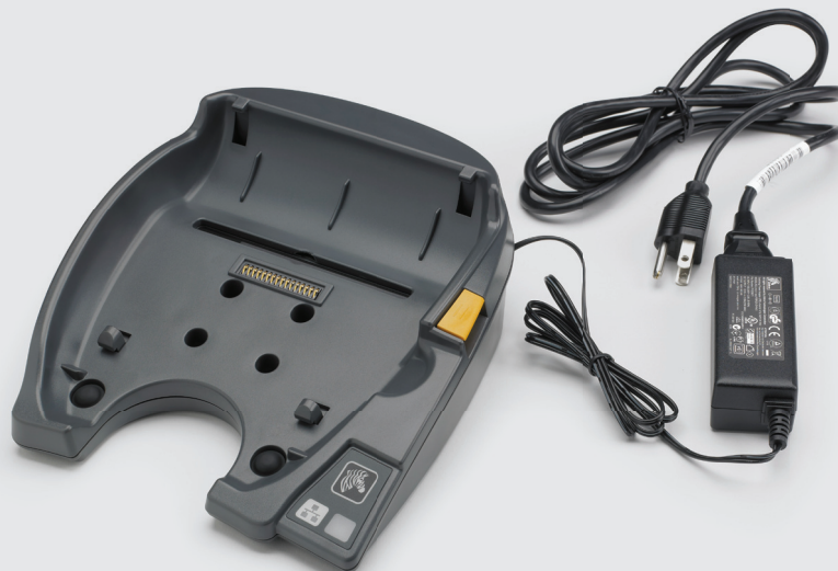
Station de chargement à connexion Ethernet pour QLn420